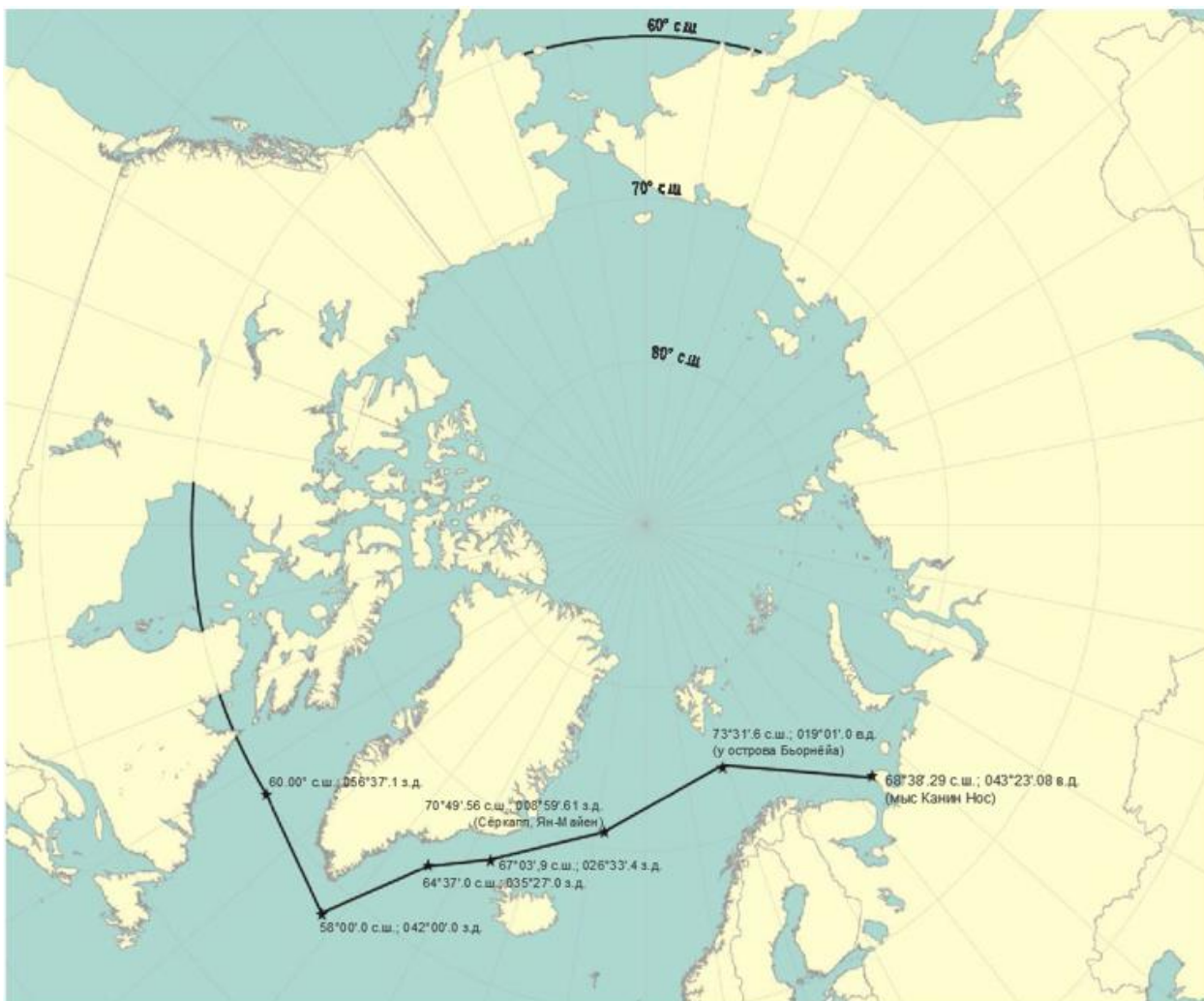
Рис. 1.1.1-1 Границы района Арктики 1